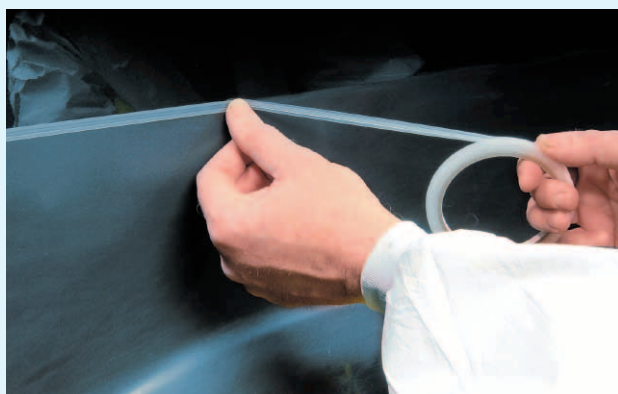
Weiche Übergänge bei Teillackierungen (z.B. unterhalb)