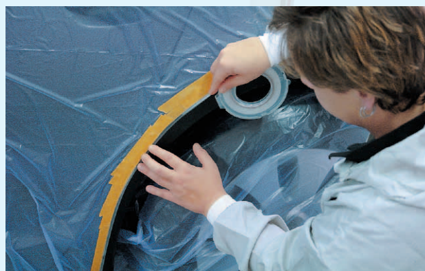
Elastischer Kunststoffträger ermöglicht problemlose Anwendung z.B. an Radläufen