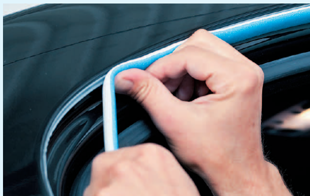
In Verbindung mit 3M™ Soft Tape PLUS optimale Ergebnisse beim Prozess Einmal-Maskieren (Füllerauftrag & Lackieren)